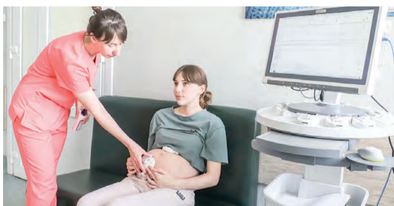
Медучреждение оснащено по последнему слову техники, что помогает обеспечить максимальную безопасность и комфорт для пациенток и их малышей