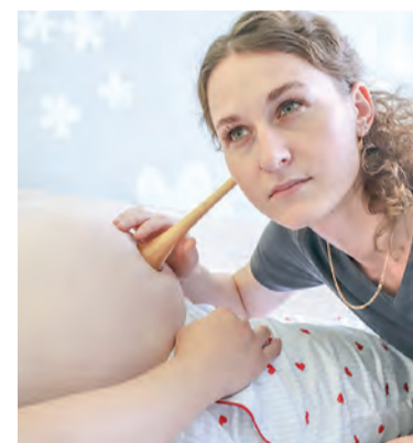
Врачи гарантируют профессиональную помощь на каждом этапе пути к материнству

В 2001 году Всемирной организацией здравоохранения и Детским фондом ООН (ЮНИСЕФ) медучреждению присвоено звание «Больница, доброжелательная к ребенку», которое успешно подтверждено в 2022 году.