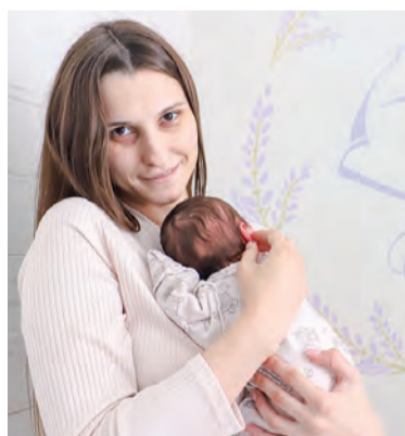
Роддом – место, где появляются на свет маленькие солнышки

Клинический родильный дом Минской области – главный роддом региона и один из лучших в стране. Он размещен в пяти корпусах, где есть 304 койки, включая 140 акушерских, 115 гинекологических, 25 педиатрических и 24 реанимационные.